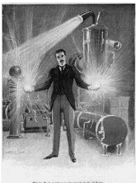
Nikola Tesla holding in his hands sphere of force

«Звездным часом» Н.Тесла было его выступление перед учеными Королевской академии Великобритании в 1892 году, где он демонстрировал пе-