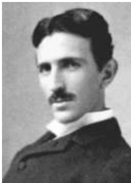
Никола Тесла (1856 – 1943)

Никола Тесла был необычным ребенком со дня своего рождения (а родился он 10 июля 1856 в Смиляне (Хорватия) в семье православного священника). С пятилетнего возраста Никола начал страдать необычными фобиями и навязчивыми идеями. В состоянии возбуждения он видел сильные вспышки света, тихие шорохи казались ему раскатами грома. Фантастические видения переполняли его мозг. Он читал «запоем», и герои книг, по его признанию, пробуждали в нём желание стать "существом высшего порядка". С маниакальным упорством воспитывая в себе силу воли, он часто доводил себя до изнурения, из-за чего часто впадал в состояние транса. Уже в юности Тесла выглядел демонически: высокий рост, предельная худоба, впалые щеки, пристальный взгляд горящих глаз.